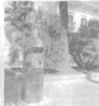
Le vecchie isole ecologiche